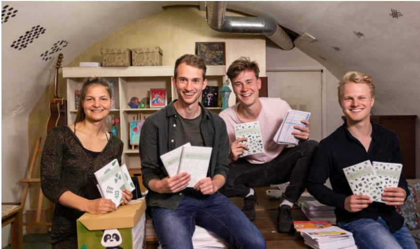
Het team van Green Side, nieuw Utrechtse Euro deelnemer